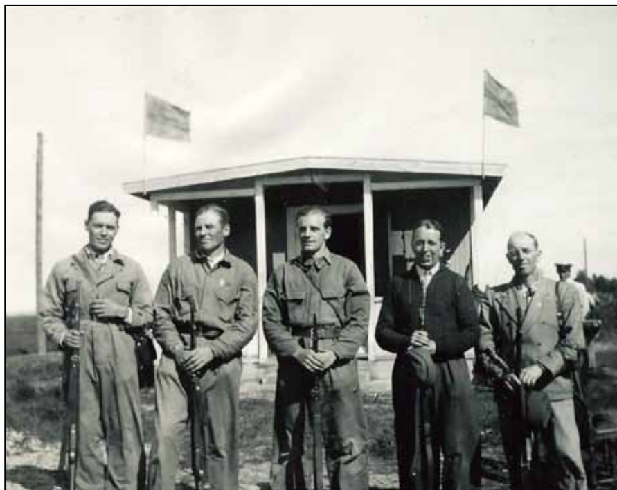
Calluna Falsterbo skytteförening, Baninvigning Ljungen 1945.

Nedan: Minnesmärket över skytteföreningen ute på skjutfältet.